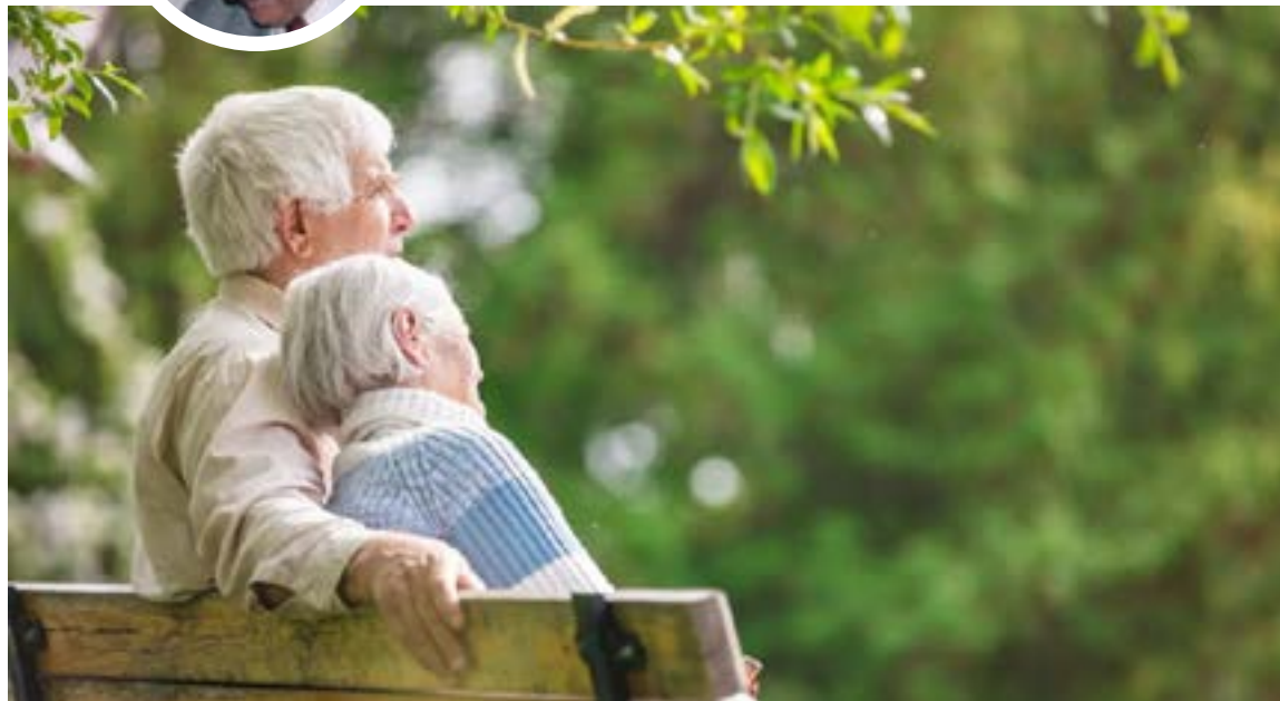
La alarma de los ancianos radica en la profunda degradación ética y moral del país, mientras que los responsables históricos de esta crisis se presentan ahora, paradójicamente, como los únicos portadores de las soluciones.

tos y desplazamiento de campesinos que deben huir sin rumbo.