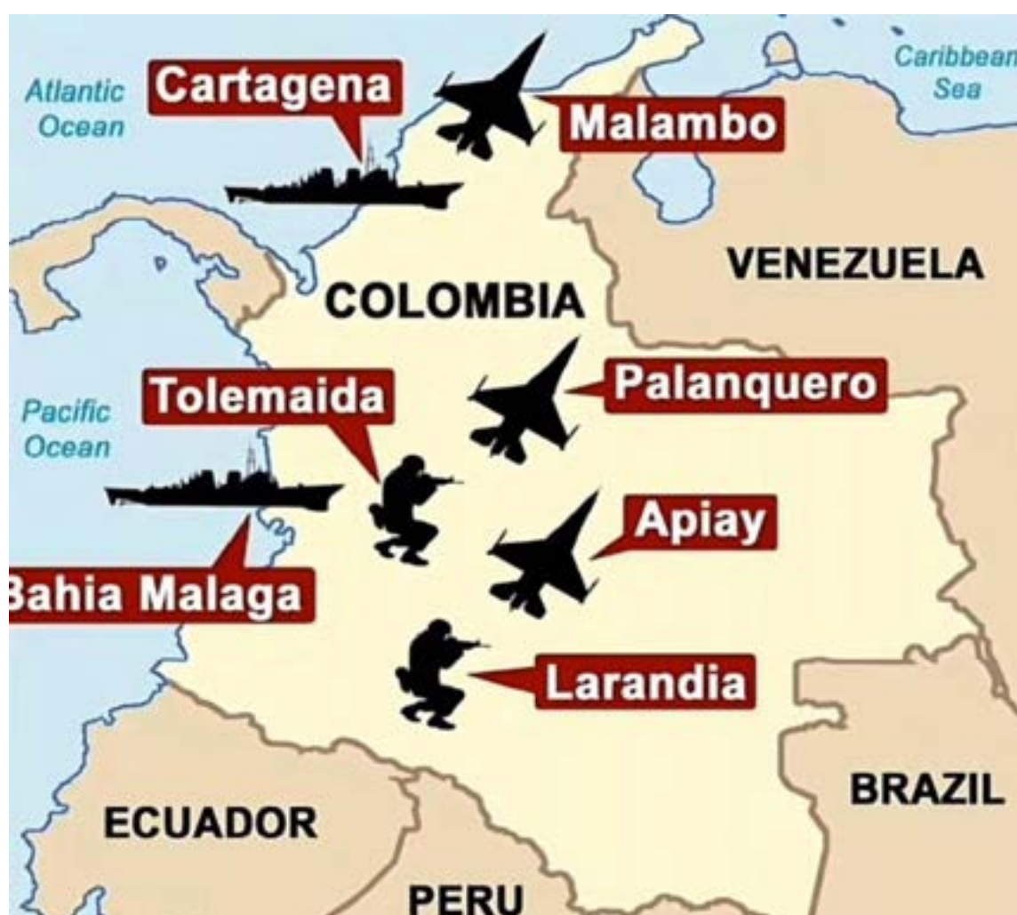
Colombia pasó a convertirse oficialmente en un portaaviones terrestre de los Estados Unidos en octubre de 2009, cuando se firmó un acuerdo entre los dos países, mediante el cual se establecieron 7 bases militares en el territorio.

La mayor controversia en la historia reciente de esta relación se desató con la firma del «Acuerdo complementario para la Cooperación y Asistencia Técnica en Defensa y Se-