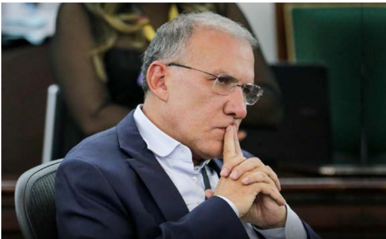
Roy Barreras Montealegre

En medio de su crítica, el precandidato presentó una propuesta de organización del Estado enfocada en la eficiencia y la coordinación de proyectos. Barreras propuso reformar los periodos del Presidente de la República y de los alcaldes de Colombia para que estos trabajen de manera coor-