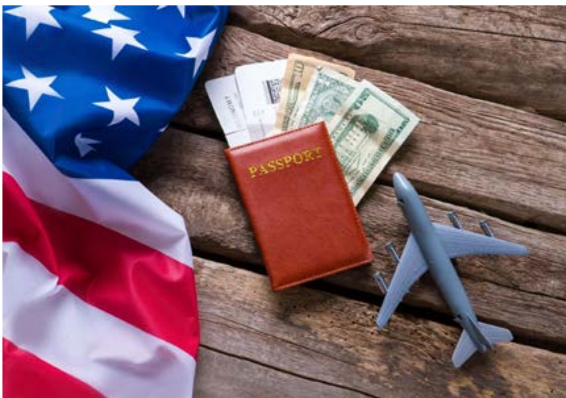
Incremento del valor de la visa a los colombianos a partir del 1o. de octubre.

B1/B2 de turismo) podría elevarse hasta los $435 USD (un alza del 135% respecto a los $185 USD actuales).