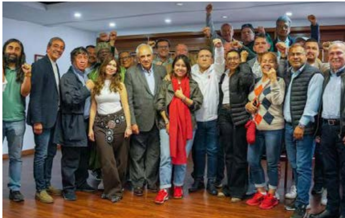
El expresidente, Ernesto Samper y el precandidato Roy Barreras, comandan el Frente Amplio para participar en una consulta con el petrismo. El ganador será el candidato oficial de la izquierda.

La oposición al Gobierno de Gustavo Petro intensifi-