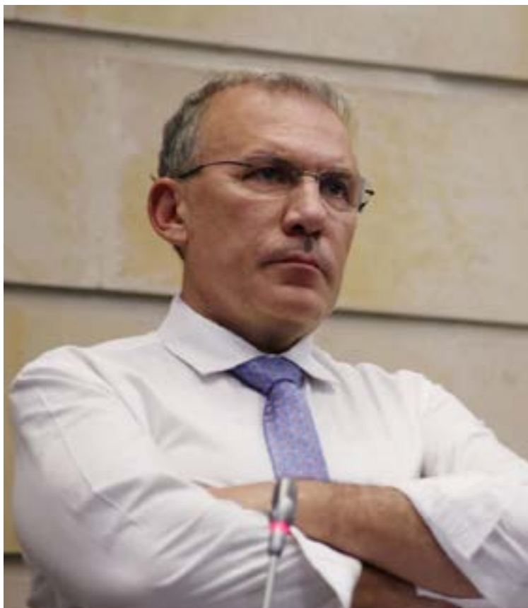
Barreras propuso reformar los periodos del Presidente de la República y de los alcaldes de Colombia para que estos trabajen de manera coordinada.

dinada. Argumentó que la falta de coincidencia en los periodos de gobierno «ocasiona que los Planes de Desarrollo del gobierno central sean diferentes a los Planes de Desarrollo de los municipios y distritos».