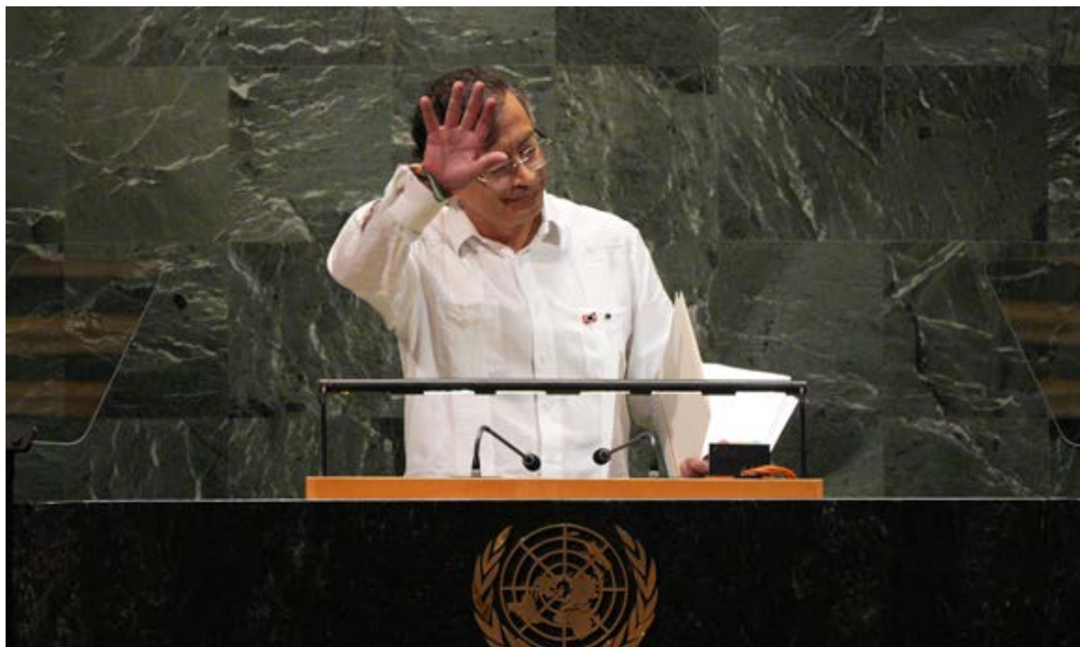
Gustavo Petro Urrego, presidente de Colombia, fue designado como padrino por los indígenas para evitar la destrucción del río Putumayo.

El epicentro del conflicto es la imposición de un proyecto minero en los municipios de Sibundoy