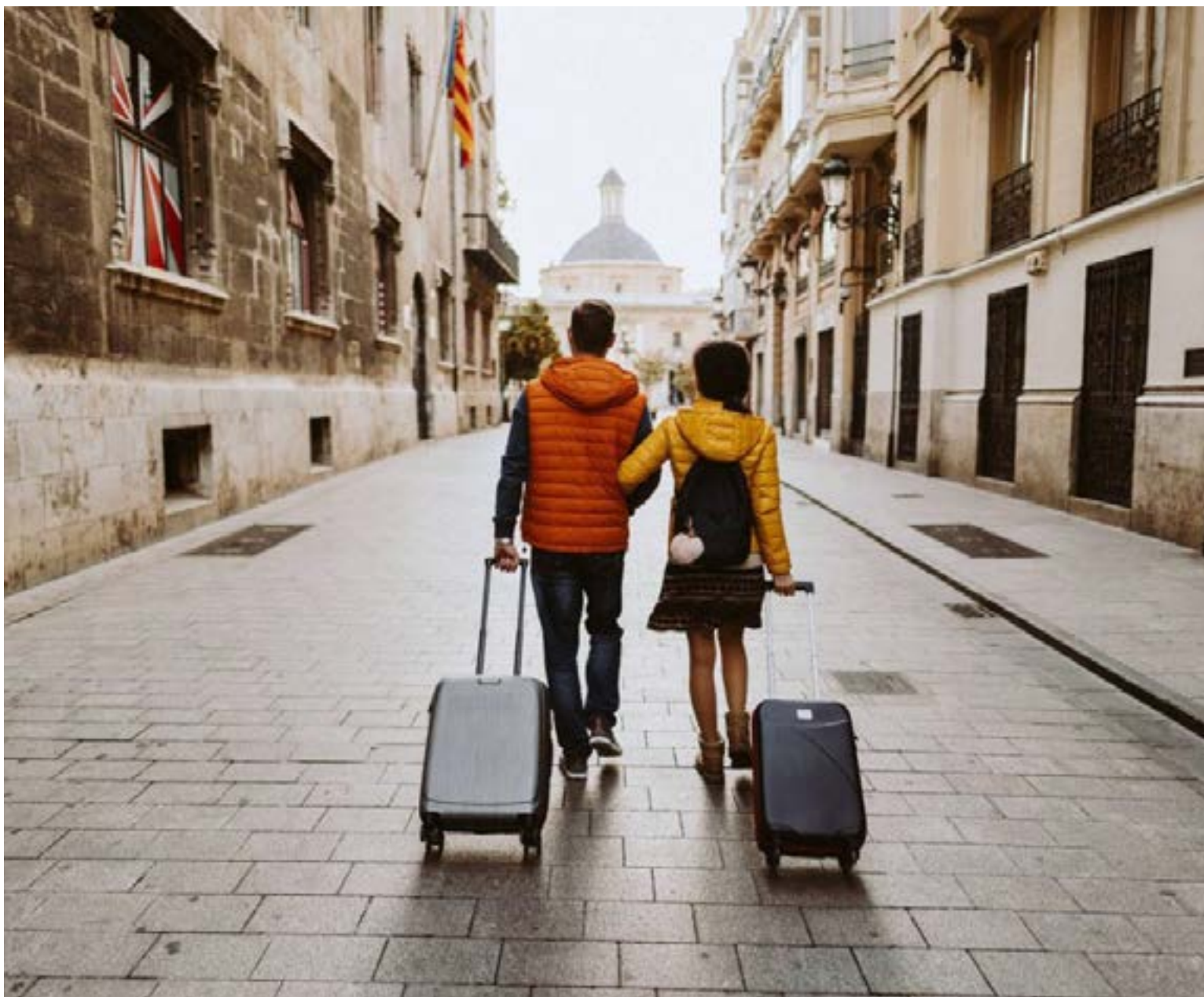
Nuevas reglas para los colombianos que viajan a Europa

Aumento Proyectado: La tarifa total para visas de no inmigrante (como la