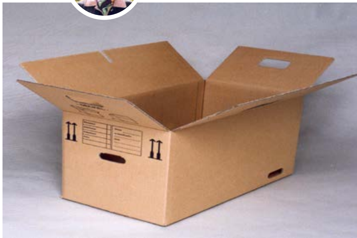
Caja de cartón

Las damas de Europa se acostumbraron a las cajas redondas, con tapas de igual forma y tonos suaves. En estas guar-